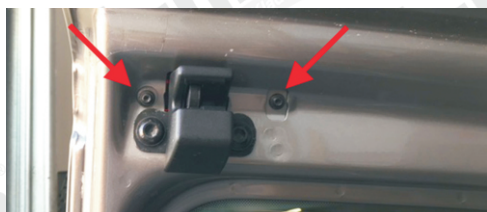
Světlo je upevněno dvěma šrouby z vnitřní strany