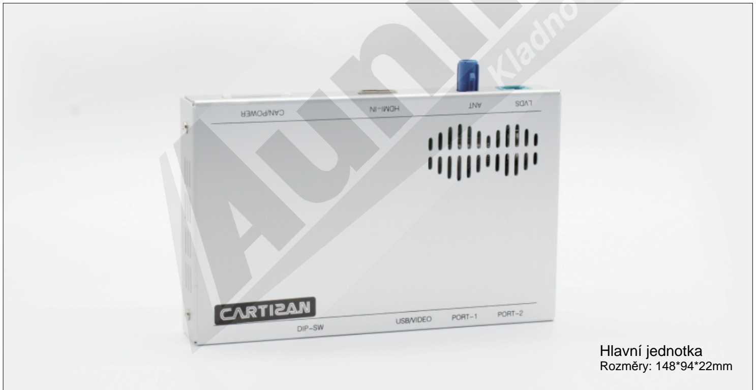
Hlavní jednotka Rozměry: 148*94*22mm